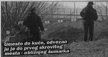
Umesto do kuće, odveo ju je do prvog skrovitog mesta - obližnjeg šumarka