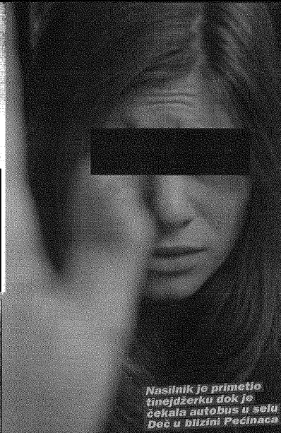
Nasilnik je primetio tinejdžerku dok je čekala autobus u selu Deča u blizini Pećinaca